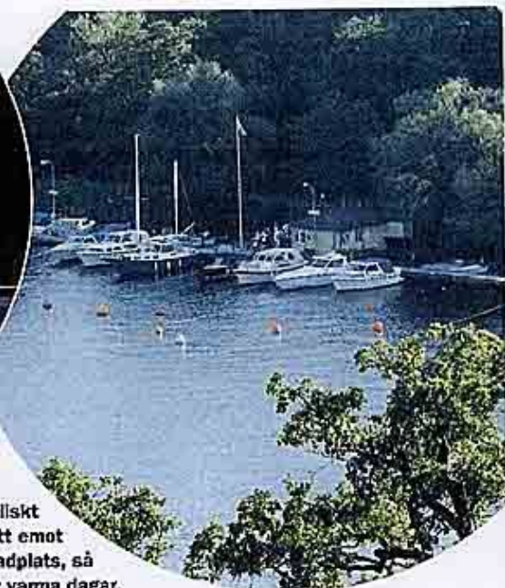
Johannesfreds BK ligger idylliskt insprängd i Bällstaviken. Mitt emot klubbens brygga ligger en badplats, så utsikten är formidabel under varma dagar.